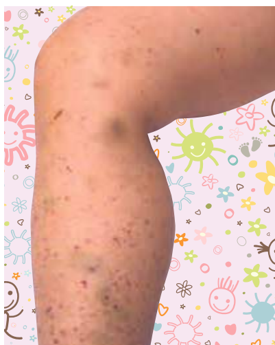
Petequias abundantes en las piernas de un niño con una infección grave

Los exantemas suelen estar producidos por infecciones que son generalmente leves o también por alergias, en cuyo caso suelen picar. Debe consultar al médico si se acompañan de fiebre o decaimiento.